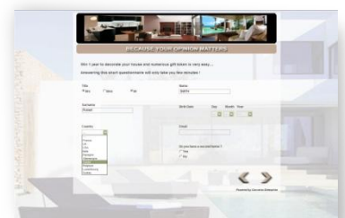
Exemple de questionnaire