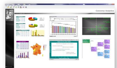
Analyse et reporting